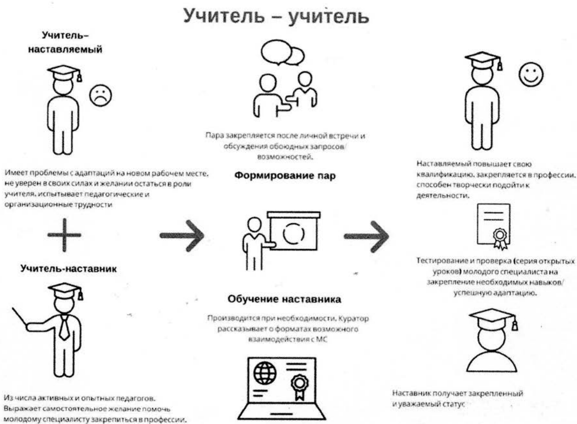
Рис.1 Форма наставничества «учитель – учитель»