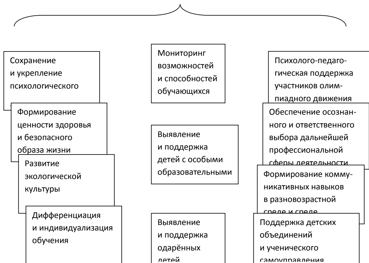
Схема психолого-педагогического сопровождения участников образовательного процесса на основной ступени общего образования